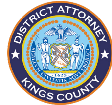
ERIC GONZALEZ FISCAL DE DISTRITO

UNIDAD DE EXPEDIENTES JUDICIALES “NO ACCESIBLES PARA EL PÚBLICO”